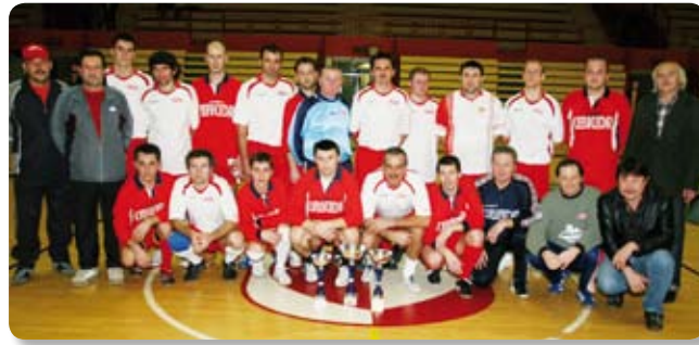
Finalisti turnira s osvojenim pokalima