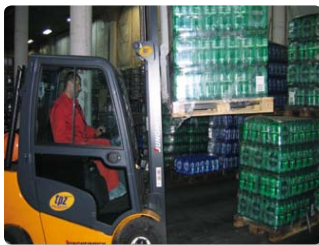
U Podravkinom riječkom distributivnom skladištu uvijek je - živo

Već tradicionalno naučeni smo od Podravkine Prodaje Hrvatska da iz godine u godinu sve ambicioznije planove i ostvare. Tako je bilo i prošle godine. Planovi su ostvareni, u nekim grupama proizvoda i prebačeni, a jedna od najboljih prodajnih regija u Hrvatskoj bila je Regija sjeverno Primorje čiji je 50-ak djelatnika nastavilo ulazni trend u prodaji. Zbog prebačaja plana Podravkaši u Rijeci ne skrivaju zadovoljstvo ostvarenim rezultatima. Posebno veseli što je i turistička sezona odlično odrađena i što su postignuti hvale vrijedni rezultati posebice u gastro segmentu. Ti rezultati su još vrijedniji kada se uzme činjenica da je prema podacima turističkih zajednica i informacijama koje smo dobili od hotelijera na području sjevernog Primorja broj noćenja i gostiju bio na prošlogodišnjoj razini, ali zahvaljujući tome što su Podravkaši kvalitetno i pravovremeno odradili pripremu sezone - potpisivanje ugovora, lobiranje, prezentacija Podravke i njezinog asortimana - sve je to rezultiralo povećanjem prodaje gotovo po svim programima, a prodajna Regija sjeverno Primorje drži primat na hrvatskom tržištu u ostvarenim rezultatima prodaje programima Pića. Glavni razlog tome je akvizicija programa Lero, izuzetno