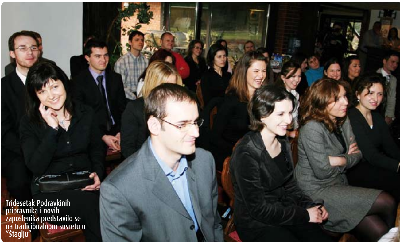
Tridesetak Podravkinih pripravnika i novih zaposlenika predstavilo se na tradicionalnom susretu u "Štaglju"

Pripravnčki program obuhvaća opći dio, specijalistički dio i edukacijski program, a prema riječima Tatjane Jukić protekle se četiri godine odvija u ovakvom obimu. To dokazuje da Podravka posebnu pažnju posvećuje novim zaposlenicima i ozbiljno pristupa radu s mladim