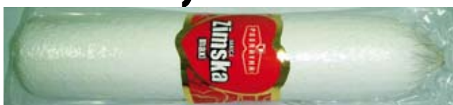
čanja ponude trajnih suhomesnatih i kobasičarskih proizvoda Podravkine mesne industrije Danica.

Ovaj proizvod prepoznatljive visoke kvalitete pod markom Podravka lansiran je na tržište u cilju proširenja asortimana i pove-