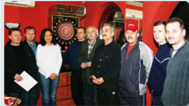
Branitelji su se u Koprivnici počeli okupljati oko elektroničkih pikada