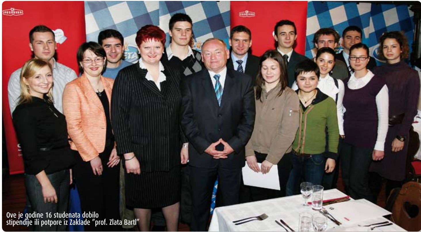
Ove je godine 16 studenata dobilo stipendije ili potpore iz Zaklade "prof. Zlata Bartl"

Tom su prigodom studenti doznali da je Podravka donijela odluku o osnivanju Zaklade "prof. Zlata Bartl" 18. listopada 2001. godine u cilju promicanja i poticanja stvaralačkog iinovativnogznanstveno-istraživačkog rada među mladim visokoobrazovanim ljudima, državljanima Republike Hrvatske, bez obzira na struku i mjesto studiranja. Njezinim osnivanjem Podravka želi potaknuti stvaranje novih vrhunskih znanstvenika i istraživača po uzoru na prof. Zlatu Bartl. Aktivnosti Zaklade "Prof. Zlata Bartl" usmjerene su na pronalaženje talentiranih mladih ljudi i kontinuirano ulaganje u njihova znanja i vještine, a jedan je od najvažnijih ciljeva uzorno, uspješno i uporno trađenje novih ideja i vizija. Osnovni je kriterij za dodjelu stipendija i potpora Zaklade "Prof. Zlata Bartl" izvrsnost kandidata u studiju i znanstveno-istraživačkom radu. ■