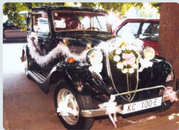
Podravkin oldtimer već je spreman za svečanu svadbenu povorku

Ulaz na ovu jedinstvenu sajamsku priredbu je besplatan, ali svi posjetitelji mogu kupiti tombolu putem kojih će doći do vrijednih nagrada (značajan dio dobitaka osigurala je i Podravka), ali i omogućiti donaciju za udrugu osoba s invaliditetom "Bolje sutra" iz Koprivnice. J. L.