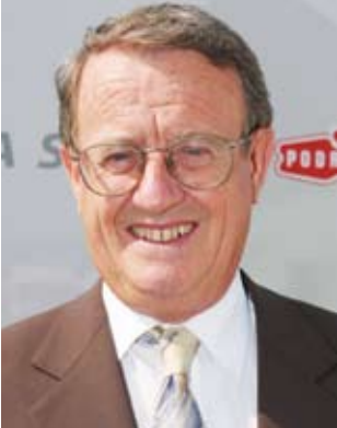
Piše: dr. Ivo Belan

Postoje slučajevi kad čovjek iz čista mira osjeća ti simptome poput hladnog znoja na čelu, tupu bol ispod grudne kosti, nešto mučnine i čudnog osjećaja straha. Obično se tome ne posvećuje neka posebna pažnja, a simptomi nakon nekog vremena nestanu.