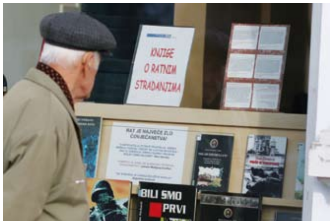
Izložba knjiga o ratnim stradanjima

Rat i ratna razaranja, bez obzira koliko mi to željeli, ne smiju se zaboraviti, a vrlo je dobro što na ovom festivalu posjetitelji mogu pogledati ratne igrane filmove iz različitih zemalja