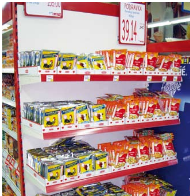
Podravkini proizvodi dobro su zastupljeni na policama trgovina u Beogradu i u drugim gradovima i mjestima u Srbiji

- Za izvršenje promotivnih aktivnosti koristimo agenciju, kao i za zakup medija, a ovdje koordiniramo s ostalim sektorima u poduzeću i agencijama. Jako je puno aktivnosti bilo tijekom cijele godine. Kroz ATL kampanje podržavamo samo pojedine proizvode unutar neke već kategorije proizvoda poput Vegete, Podravka jela, dječje hrane i Dolcele. Najznačajnija marketinška kampanja bila je za Vegetu, Podravka juhe, Evu, Čokolino žitarice i namaze te Dolcele kroasane. Organizira-