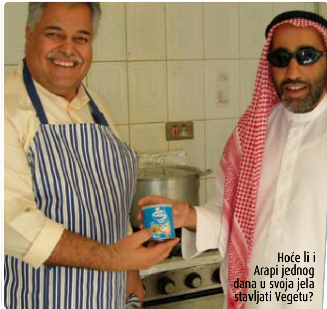
Hoće li i Arapi jednog dana u svoja jela stavljati Vegetu?