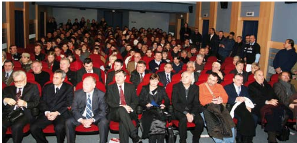
Na otvorenju Prvog festivala ratnih igranih filmova dvorana kina "Velebit" bila je dupkom puna

U Podravki je održan Okrugli stol na temu: "Hrvatski ratni film"