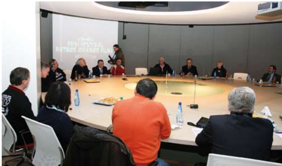
Okrugli stol o hrvatskom ratnom filmu održan je u Podravki

Dvorana kina "Velebit" u Koprivnici bila je preplavljena da primi sve one koji su u ulazak željeli biti na svečanom otvorenju Prvog festivala ratnih igranih filmova, koji se od 15. do 17. siječnja u organizaciji Udruge branitelja, invalida i udovica Domovinskog rata Podravke (UBUDR) i Pučkog otvorenog učilišta, a u povodu međunarodnog priznanja Republike Hrvatske i pod pokroviteljstvom Ministarstva obitelji, branitelja i međugeneracijske solidarnosti održavao u našem gradu.