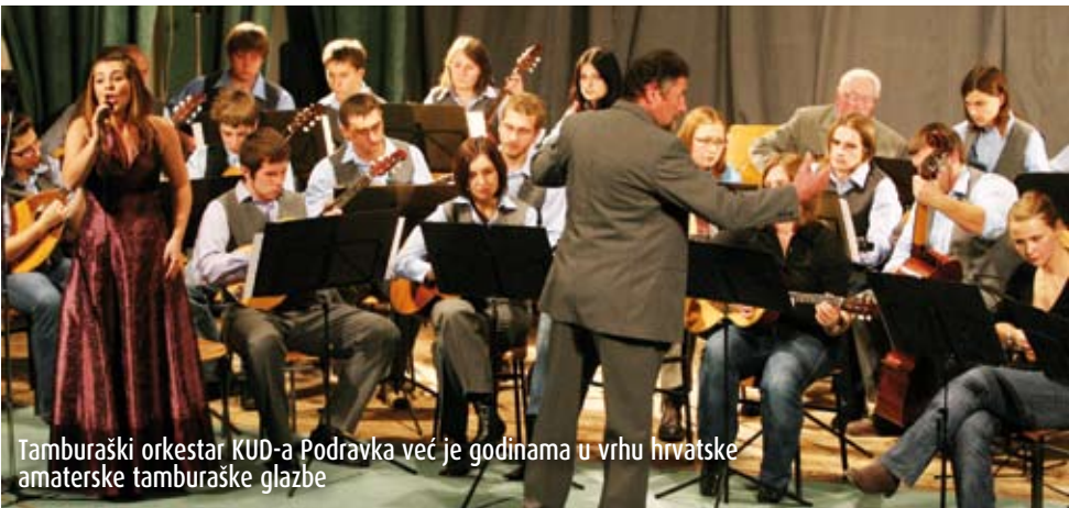
Tamburaški orkestar KUD-a Podravka već je godinama u vrhu hrvatske amaterske tamburaške glazbe