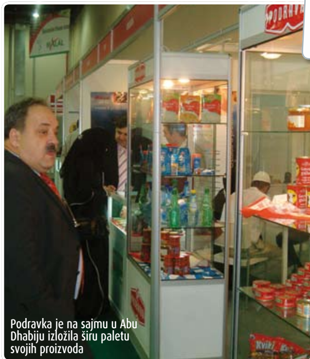
Podravka je na sajmu u Abu Dhabiju izložila širu paletu svojih proizvoda

Sljedeća prilika za prezentaciju Podravke na ovom tržištu bit će krajem veljače ove godine, na Sajmu prehrane "Gulfood" u Dubajju. ■