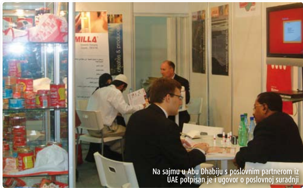
Na sajmu u Abu Dhabiju s poslovnim partnerom iz UAE potpisan je i ugovor o poslovnoj suradnji