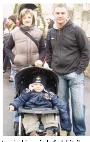
Leo je bio najmlađi dobitnik u nagradnoj igri