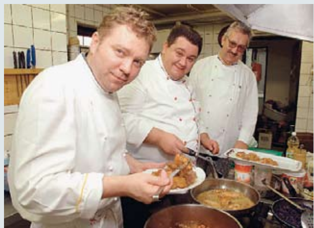
Pripremanje vrhunskih delicija u Podravskoj kleti