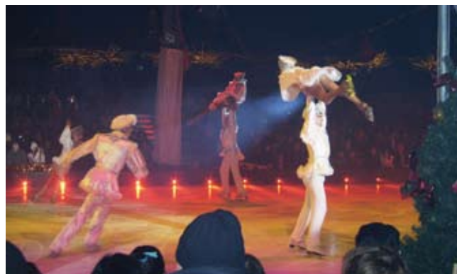
Show na ledu oduševio je sve posjetitelje

jila svojom otvorenosti, komunikativnosti i spremnošću da udovoljava našim zahtjevima, zbližili smo se i međusobno. Zato su razmijenjene adrese, brojevi telefona, a u ova tri prekrasna dana, osim poznanstava i prijateljstava, razvile su