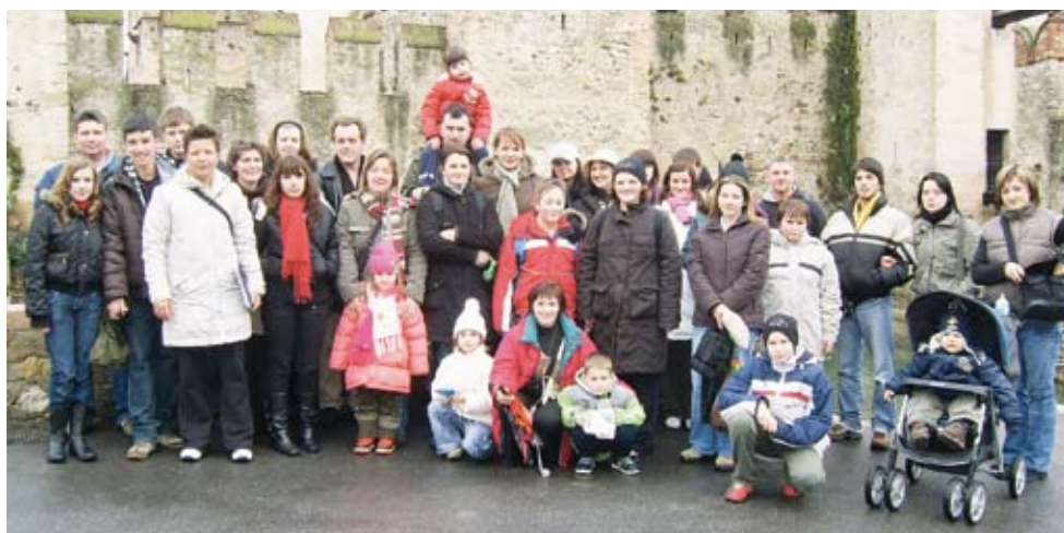
Sudionici putovanja u Sirmioneu