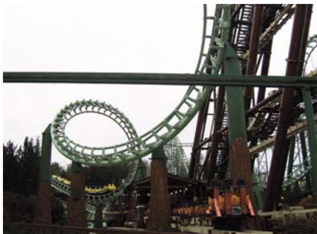
Na vožnju Gardaland vlakom odlučili su se samo oni hrabriji

da bi bio u trendu sluša i dalje domaću glazbu, jednako ga zanima tamburaška, klap-ska i glazba svih hrvatskih podneblja. ■