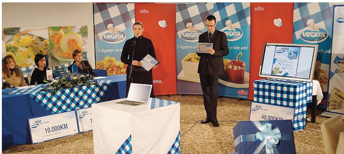
Izvlačenje imena dobitnika nagradne igre "VEGETA - novi recept do nagrada" organizirane na području Bosne i Hercegovine