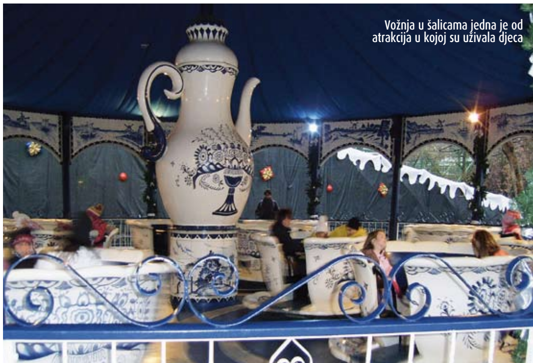
Vožnja u šalicama jedna je od atrakcija u kojoj su uživala djeca

Dobro je što nema gužve, nigdje se ne mora čekati u redu - rekao je Marin koji je sedam puta iskušao "slobodan pad" i čak deset puta vožnju vlakom. Njegova tetka Marina ipak je malo teže podnijela vožnju pa se potom radije držala čvrstog tla pod nogama i krenula u potragu za razglednicama. No, nisu samo djeca uživala