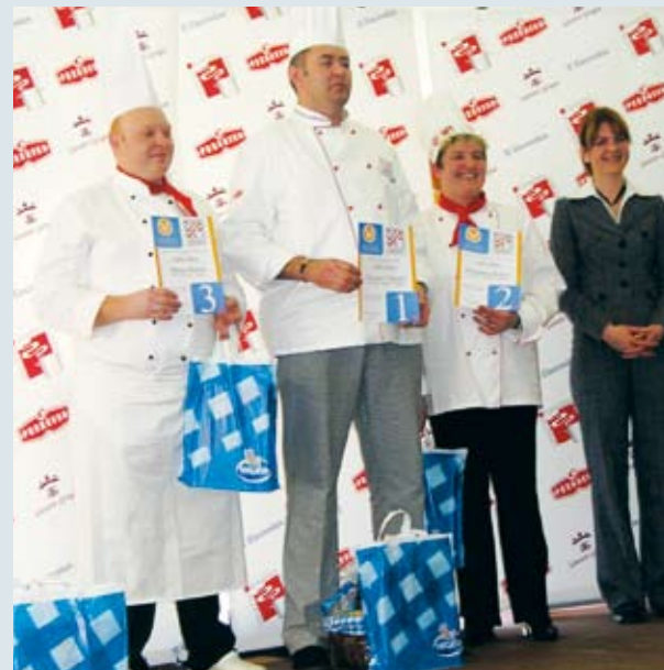
Najbolji na Kuharskom kupu u Splitu dobili su poklone Podravke

Drugo kolo pod nazivom "Zlatno sunce" održat će se 30. ožujka na Hvaru. I. B.