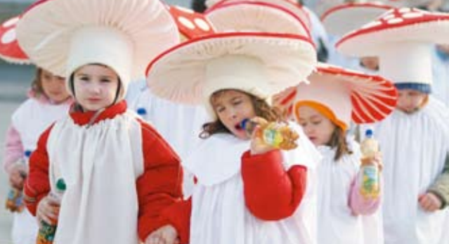
Nakon brzih plesnih ritmova malim maskarama najbolje osvježenje bili su Studena i sokovi Deit

Veselu kolonu predvodio je Podravkin oldtimer "balila" vozeći podravskog tajkuma koji je zajedno s tajkumicom preuzeo ključeve Grada obećavajući da će u novooasnovanoj Tajkumskoj republici uživati u raznoraznim blagodatima. No na kraju morali su skinuti maske i vratiti ključeve gradonačelniku koji