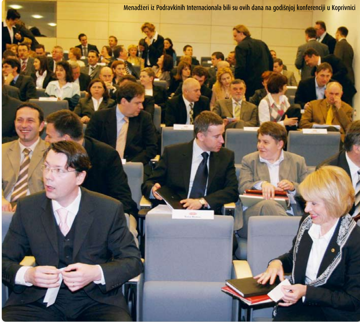
Menadžeri iz Podravkinih Internacionala bili su ovih dana na godišnjoj konferenciji u Koprivnici