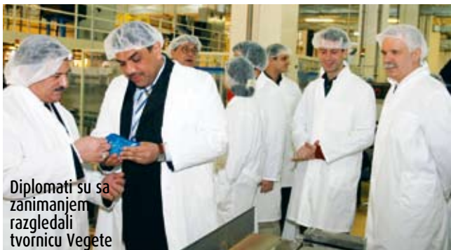
Diplomati su sa zanimanjem razgledali tvornicu Vegete

Odgovore o kvaliteti proizvoda diplomati su mogli potražiti pri obilasku tvornice Vegete i Podravka jela, a da je Podravka i odlična kulinarska institucija, uvjerali su se u gastronomsko-edukacijskom centru "Štagelj". ■