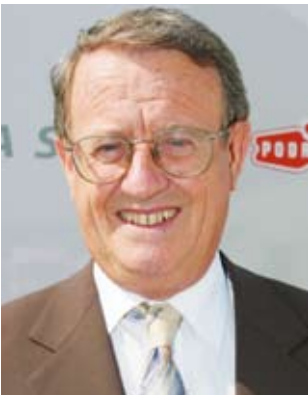
Piše: dr. Ivo Belan

Većina od nas i te kako brine o svojoj kosi (zabrnuti smo i kad ju nemamo). Prvo, pogledajmo kako izgleda normalan rast kose. Folikul dlake ili kose, koji se nalazi neposredno ispod površine kože, osnovna je struktura iz koje započinje rast. Ako je folikul uništen, nova se vlas ne može stvoriti. Ako je vlas iščupana ili prerezana, ali je folikul ostao neoštećen, nova vlas će narasti. Na vlašistu glave ima oko 100.000 folikula. Taj se broj smanjuje sa dobi života. Važno je istaknuti da svaka vlas koju vidimo iznad kože predstavlja mrtvo bjelancevinasto tkivo. Na vlašistu (skalpu) svaka vlas raste neprekidno 3-5 godina. Tada se rast zaustavlja i nakon 3 do 4 mjeseca vlas otpada. U daljnjih 3 mjeseca (to je faza mirovanja) iz istog folikula počinje rasti nova vlas. Vlas na glavi raste otprilike jedan centimetar mjesečno.