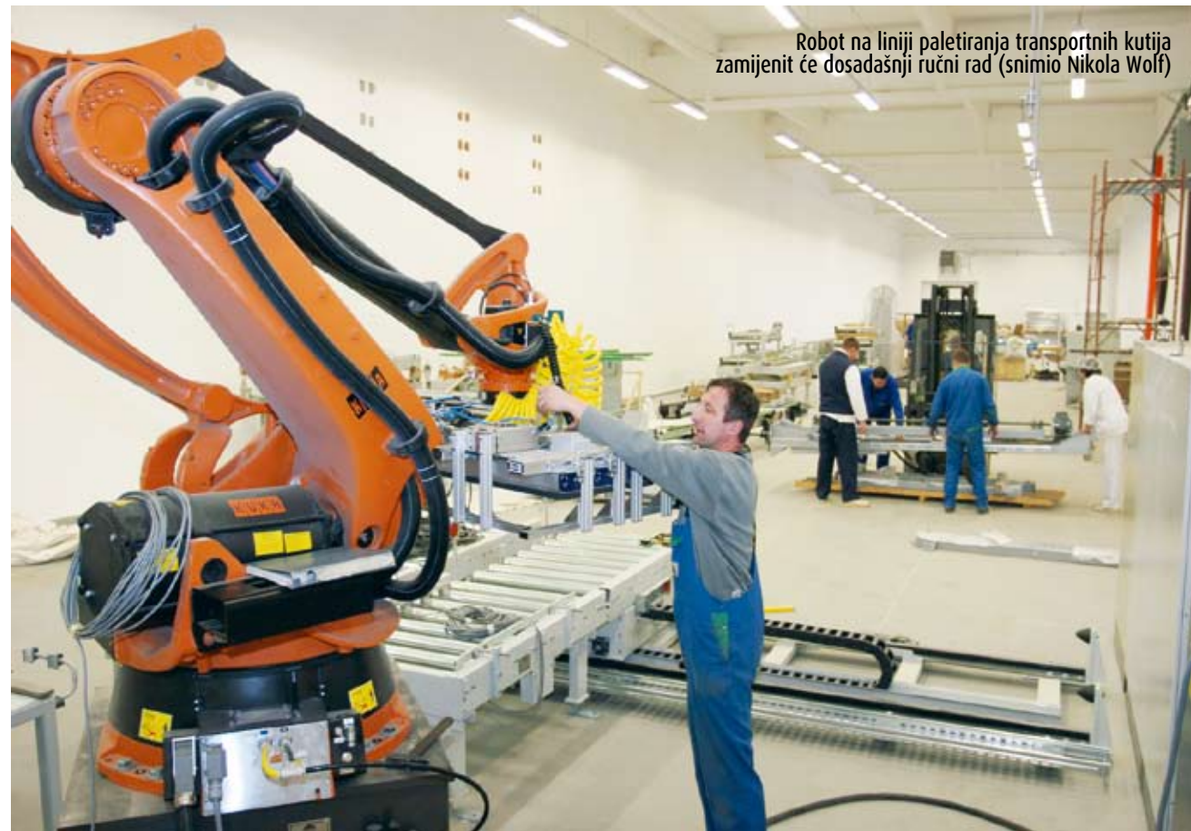
Robot na liniji paletiranja transportnih kutija zamijenit će dosadašnji ručni rad

Izgradnja nove Podravkine tvornice dječje hrane