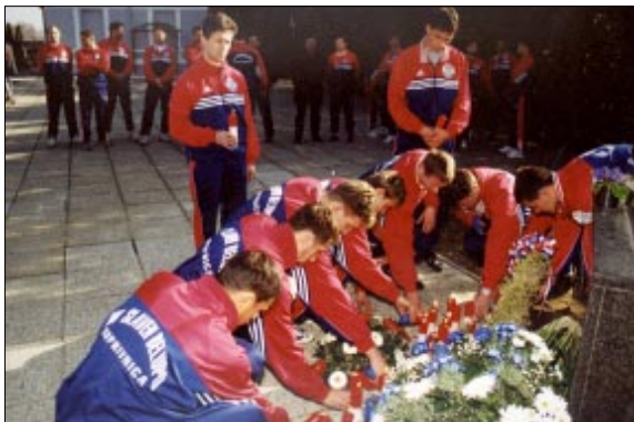
Na slici N. Wolfa: Nogometaši našeg prvoligaša zapalili su svijeće za sve poginule i nestale hrvatske branitelje

Bila je to prigoda da se "Slavenaši" još jednom poklone ljudima koji su dali živote za stvaranje slobodne i samostalne hrvatske države, te da podno križa polože vijenac i zapale svijeće. IMI. P.