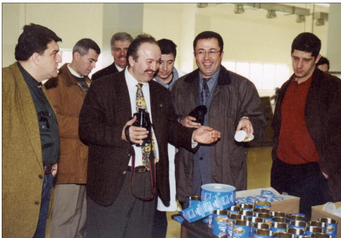
Najveće zanimane gosti iz Turske pokazali za proizvodnju Vegete

Piše: Jadranka Lakuš