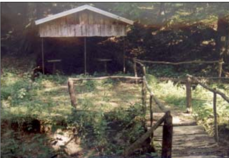
Izvorište Bukovac - mjesto gdje izvire voda - čisti, zdravi i nedirnuti dar prirode

prirode, biser slavonskog gorja i čudesni nektar stoljetnih slavonskih šuma punjenjem u boce u Tvornici Studenac u Lipiku postaje dostupna svima koji žele piti pravu i zdravu izvorsku vodu.