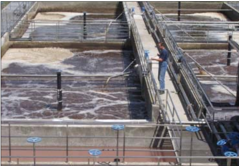
U pročišćavanje otpadnih voda u industrijskoj zoni Danica Podravka je investirala više od tri milijuna kuna

Ovim značajnim zahtovima Podravka nije samo ispunila svoju obvezu iz "Akcijskog plana zaštite okoliša u koncernu Podravka" već je u velikoj mjeri pridonijela zaštiti okoliša našeg kraja osobito voda kako podzemnih tako i nadzemnih i smanjenje troškova eksploatacije i naknada za ispuštanje voda. Postizanjem punog kapaciteta pročišćavanja otpadne vode Podravkinih tvornica pročišćene su do nivoa dovoljnog za direktno ispuštanje u prirodne vodotoke a ne samo u kolektor što je bio postavljeni zadatak.