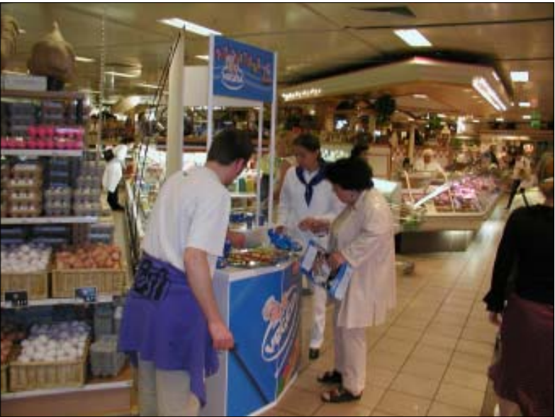
Vegetu sve više vole i Nijemci

- Vegetu predstavljamo kao izvorni hrvatski proizvod, koji se dobro uklapa u laganu mediteransku prehranu koja je trenutno u trendu u Njemačkoj. U akciji, inače prvom takvom predstavljanju Vegete na području cijele zemlje otkako postoji Podravkin International u Njemačkoj, koristimo sva znanja i iskustva koje je naša kompanija do sada prikupila. Već prvi