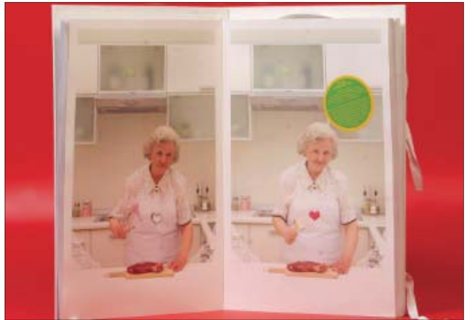
Jedna od stranica Podravkinog Godišnjeg izvješća za 2005. godinu

Agencija Bruketa & Žinić u projektu još jednog Podravkinog izvješća, istaknula se originalnošću ideje i kreativnosti izvedbe, dokazala je svoju kvalitetu i otvorila put novim kontaktima. Čitanje godišnjeg izvješća dobiva time