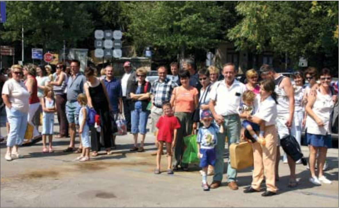
Dolazak Podravkinih branitelja u Opatiju bila je i prilika za zajedničku snimku, jer vrlo brzo nakon toga svatko je otišao na "svoju" plažu