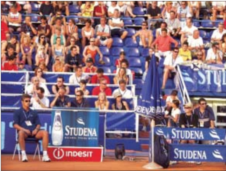
Studena na lanjskom ATP turniru u Umagu

Partnerska akcija Podravke i Top termi Topusko