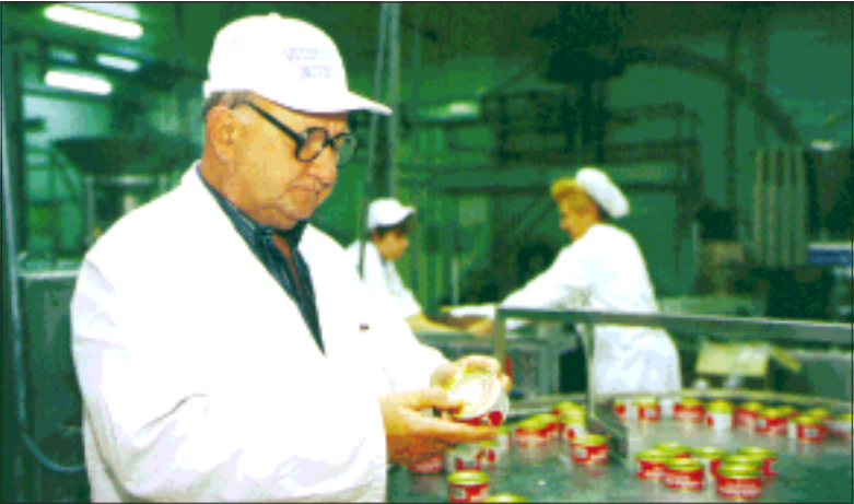
Nakon detaljnog pregleda "Danica" je zadržala svoj izvozni broj

- Na "Danici" se primjenjuju najstrožiji propisi ne samo Europske unije nego i Sjedinjenih Američkih Država, a mi nastojimo pronaći zajednički jezik na poboljšanju kvalitete i zdravstveno- higijenske ispravnosti mesa i