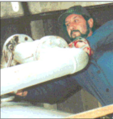
Za sve je kriv kotao: demontaža je počela

- Ne, postojeći Podravkini poslovni prostori zadovoljavaju potrebe. S obzirom na to da je dio ljudi iz administracije, iz sedmero-