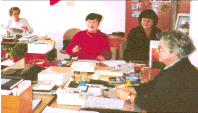
Službenice Sektora za upravljanje plaća selile su se 6 puta u zadnje tri godine

Teoretska tvrdnja da mahanje leptirovim krilcima u Tokiju ima veze s potresom u Londonu doživjela je dakle ove kasne jeseni ostvarenje u Podravkinim uredskim prostorima s dviju strana Kolodvorske ulice. U tom konkretnom slučaju leptir je pedeset godina star parni kotao, koji je uzrok svemu, Tokio je zgrada koju je još uvijek najlakše objasniti sintagmom "bivši Galantplet", a London je bivše "Izvorovo" skladište u Kolodvorskoj ulici, preuređeno 1996. godine u kancelarije za Podravkine namještene. U zgradi bivšeg "Galantpleta" smještene su sindikati, socijalna služba, administracija i čelništvo "Podravskih mlinova", tamo su prostorije Podravkine udruge branitelja, a na katu svoje probe održava pjevački zbor KUD-a "Podravka". Tako ili slično već je tko zna koliko godina i usprkos također višegodišnjoj priči o rušenju "Galantpleta", tako je bilo i ovog ljeta, a tako bi i dalje bilo da radne prostore zimi ne treba grijati. A te prostorije već pedeset godina grije jedan parni kotao, ložen prvo plinom, pa zatim ugljenom, pa opet plinom. Taj kotao nije proveden kroz "papire", nema atest niti dozvolu za rad, što bi svaki pristojan kotao trebao imati. Ove je godine šibica dogorjela do prstiju, tj. gradski inspektor zaštite na radu upozorio je Podravku neka niti ne pokušava paliti taj kotao jer će momentalno stići zabrana, a bogme i kazna.