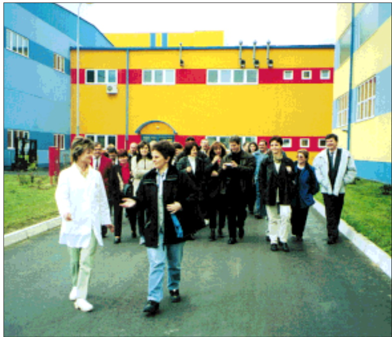
Kemičari iz Belišća sa zanimanjem su razgledali novu Tvornicu "Vegete"