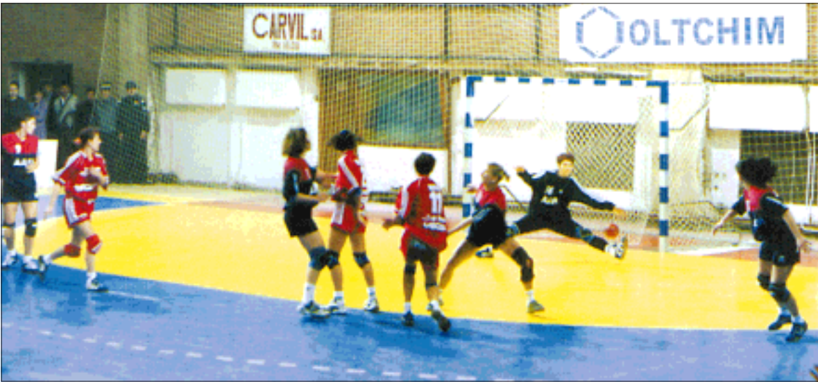
Poraz usprkos dobroj igri

štu i lijepoj Vilcei od 8. do 13. prosinca održava Europsko rukometno prvenstvo (bez Hrvatske, nažalost).