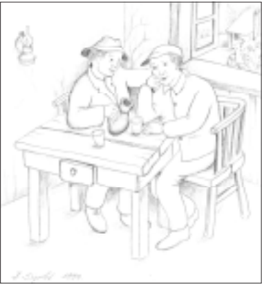
Dobro mi došiel prijatel...

Štimung Martinjske noći u velikoj kristalnoj dvorani zagrebačkog hotela Interkontinental dosegnuo je vrhunac dolaskom u goste predsjednika Stjepana Mesića i još nekih visokih državnih dužnosnika, kao da su čuli popevku "Dobro mi došiel prijatel". Naime, kada smo u prošlom broju našeg lista dali podršku ovakvim druženjima i sponzorstvima u cilju promocije Podravine i jačanju podravskog lobija u metropoli, nismo ni slutili da će se upravo to dogoditi na najljepši mogući način dolaskom visokih uzvanika. Za stolom domaćina znanih Podravaca Martina Špegelja, predsjednika društva "Podravec" Jože Gažija i podpredsjednika poznatog "Podravkaša" Dražena Berte, književnika Paje Kanižaja te direktora Pivovare Željka Markovića (ovog puta kao predstavnika glavnog sponzora) našli su se uz predsjednika Mesića, gradonačelnik grada Zagreba Milan Bandić,