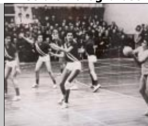
Obilježavanje 45 godina ženskog rukometa u Koprivnici 8. str.