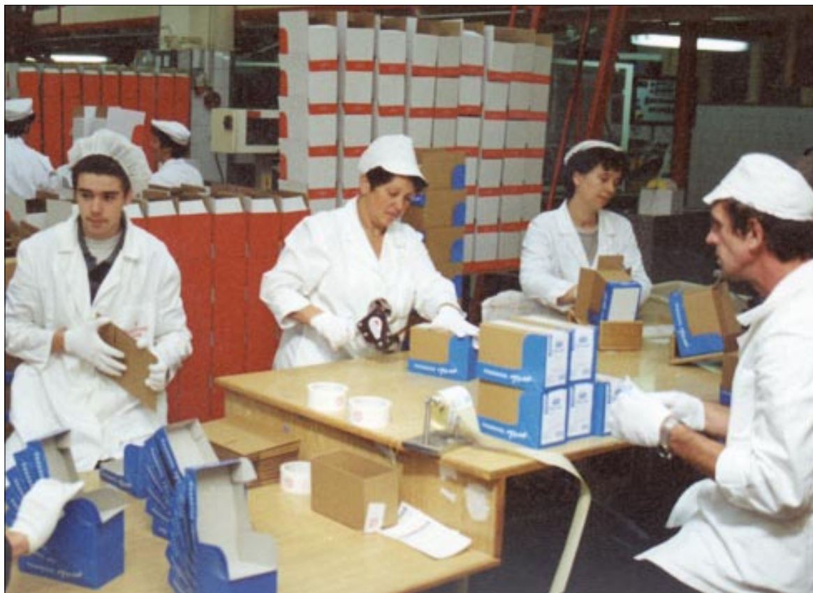
Zaposlenici Podravke dobit će ove godine božićnicu u novcu i bonovima