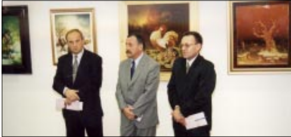
S otvorenja izložbe

Svi zainteresirani izložbu mogu razgledati do 20. siječnja iduće godine.