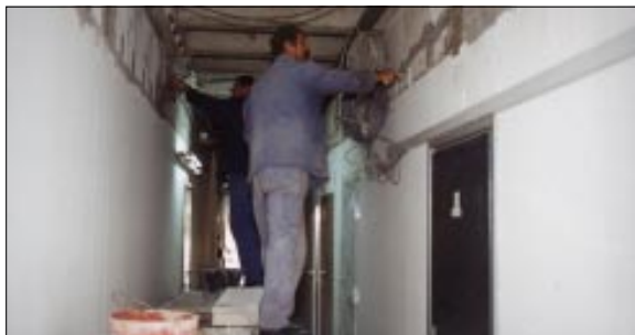
Uskoro završava prva faza rekonstrukcije "Instituta", u koju će Podravka ukupno investirati 6 milijuna kuna

Obnovljeni prostori doprinjet će sigurnijem i kvalitetnijem obavljanju poslova, kao i većem zadovoljstvu zaposlenika Sektora za istraživanje i razvoj.