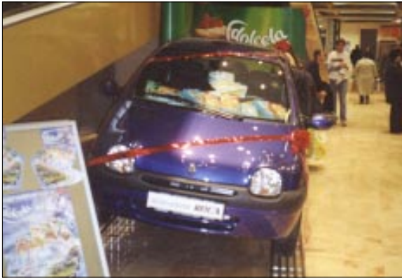
Twingo - slatka fantazija ili slatka stvarnost

Tako je bilo i prilikom otvorenja. U predvorju Eurovibe Dolcela je izložila automobil Renault Twingo - glavnu nagradu u nagradnoj igri "Dolcela - put slatkih želja" koja će trajati do