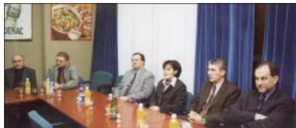
Utjecajni Podravci o Podravki i Podravini