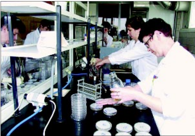
Bez rigorozne kontrole proizvodnja u Mesnoj industriji Danica je nezamisliva

nam je rekla da oni zapošljavaju trinaest djelatnika (sedam tehničara je zaposleno u kemijskom laboratoriju, a šest u mikrobiološkom, kojim rukovodi inž. Anica Lončar). Njihova je zadaća određivanje zdravstvene ispravnosti svih ulaznih sirovina, od mesa, aditiva, začina, ambalaže, tehnološke vode, do gotovog proizvoda, a vođeni su nizom pozitivnih zakona i propisa.