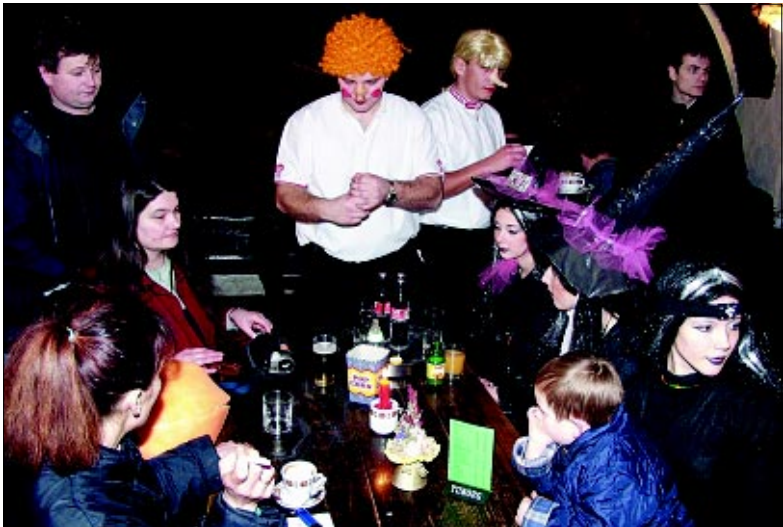
Male maškare su se u Domu mladih igrale u nagradnoj igri, a veće maškare bile su u pivnici gdje su ih posluživali maskirani konobari