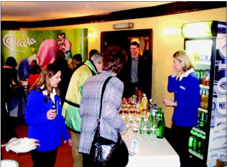
"Studenac", "Studena" i sokovi "Deit" fino su se "uklopili" u Zagrebački festival slastica

nja, a na Valentinovo, posljednjeg dana festivala, Obrtnička komora grada Zagreba u Smaragdnoj dvorani hotela Esplanade organizirala je gala večeru pod nazivom "Candle Roses" na kojoj su gostovala brojna poznata imena iz javnog života. Naime, sav prihod sa sajma i gala večere (za koju je ulaznica koštala 500 kuna!) namijenjen je SOS-Dječjem selu Hrvatska koje skrbi za 180 mališana bez roditelja.