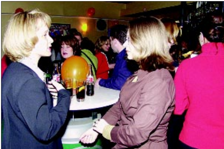
Prvo organizirano druženje Podravkaša nakon posla bilo je uspješno