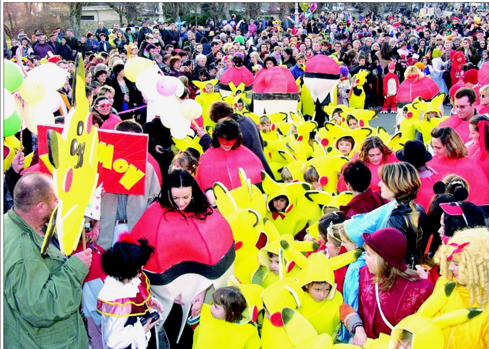
Djeca su i ove godine bila u centru fašničkog zbivanja

Piše: Jadranka Lakuš