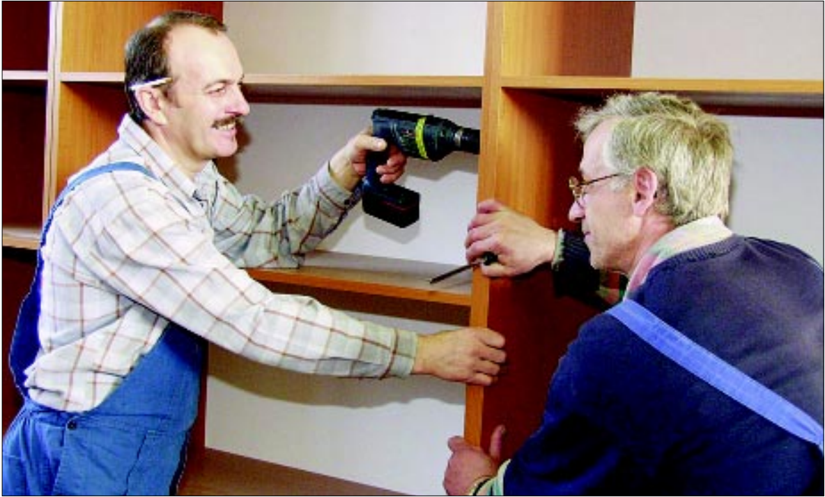
Za stolare u Stolarskoj radionici Podravkinog Održavanja uvijek ima posla, uglavnom popravaka

Iako stolari tvrde da njihova struka pomalo izumire, najviše zbog “napada” plastike, oni u Stolarskoj radionici još uvijek imaju dosta posla, tim više što se i oni prilagođavaju “modernim” materijalima i radovima (u jednom dijelu sedmorokatnice nedavno su pregradili zidove i spustili stropove).