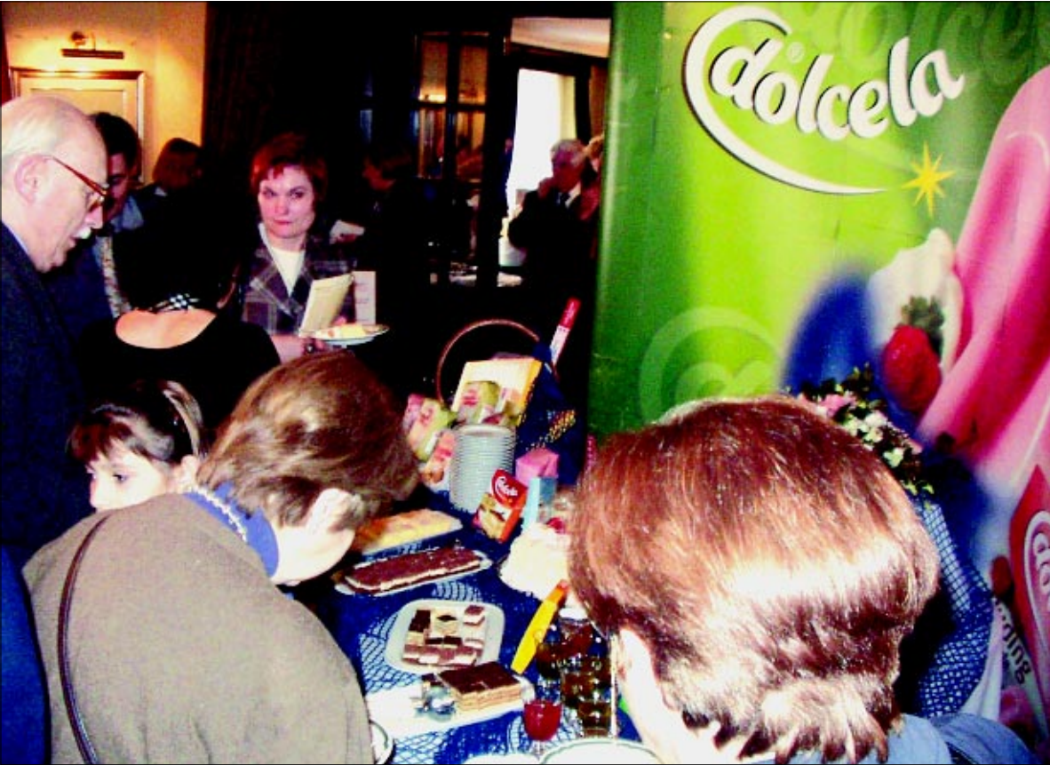
Velik broj posjetitelja degustirao je Dolceline slastice