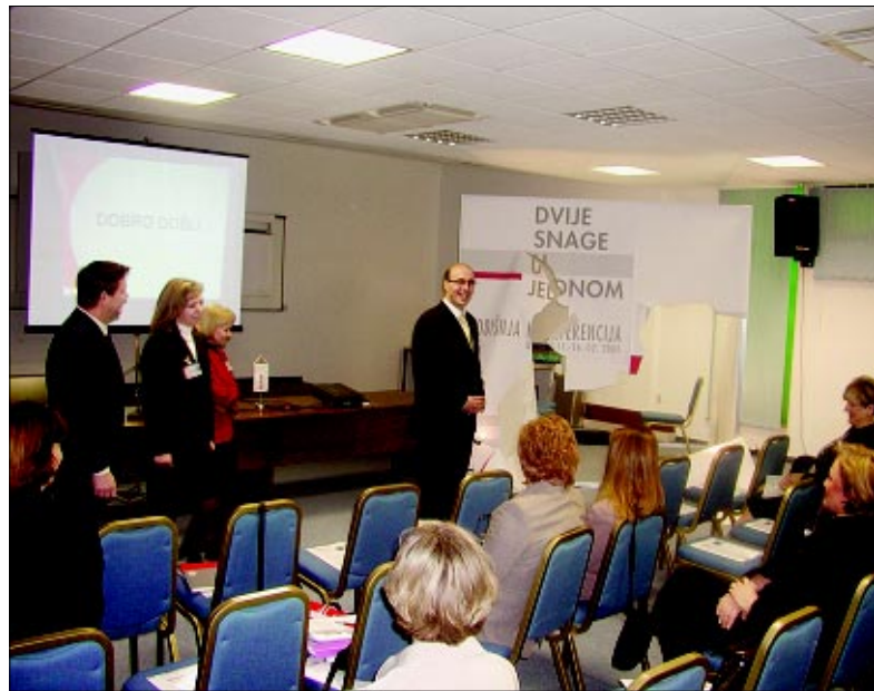
Demonstriran iskorak dviju službi u jednu snagu

Jugoslavensko tržište jedno je od najvažnijih za Podravku, koja je prva među hrvatskim tvrtkama lani u Beogradu osnovala i svoje poduzeće. Dosad provedena istraživanja tržišta pokazala su da Podravkine proizvodne marke još uvijek imaju izvrsnu poznatost među jugoslavenskim potrošačima, što je jedan od razloga zašto Podravka ima velike prodajne planove u toj zemlji. H. Š.