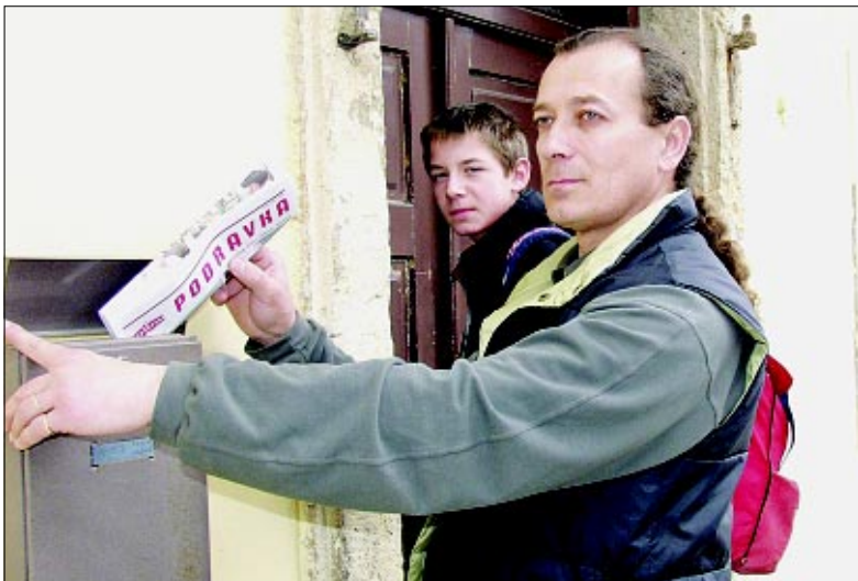
Zahvaljujući dostavljačima, Podravkine novine stižu puno brže do čitatelja