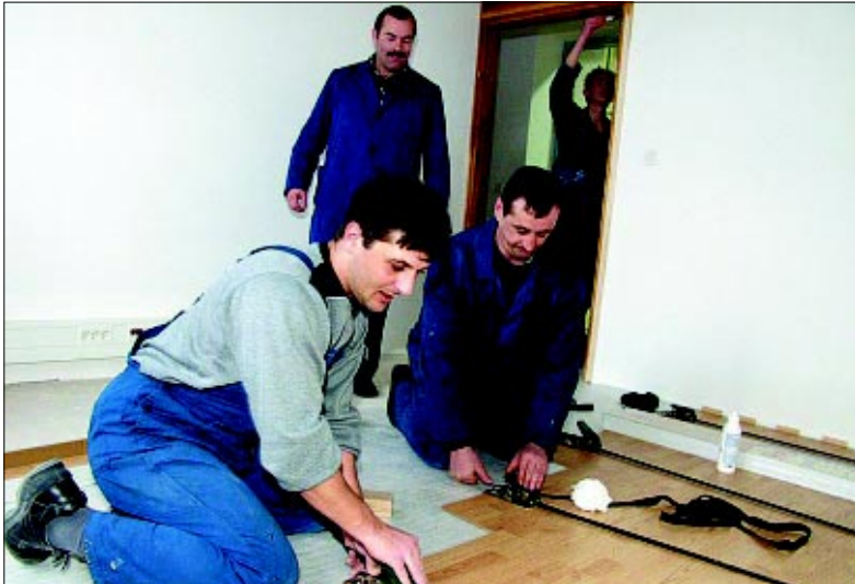
Jedan od aktualnih poslova Građevinske radionice Podravkinog Održavanja - uređenje ureda Podravskih mlinova

- Brine me kamo će ubuduće naša djeca. Već pet godina nemamo uopće učenika na praksi. Očito je da nitko više neće u zidare. Najvjerojatnije je da će se morati posegnuti za starim zidarskim majstorima, a kojih je svakim danom sve manje.