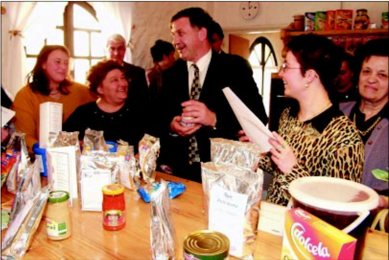
Oduševljenje mogućom primjernom Podravkinih proizvoda u talijanskoj kuhinji

- Nije mi jasno zašto Podravka sa svojom Vegetom i ostalim proizvodima već nije prisutna na talijanskom tržištu. Susjedi smo, slični po tradiciji kulinarstva, kulturi, živimo u mediteranskom okružju. Mislim da nema nikakvih zapreka da krenete u osvajanje Italije. Nas koji smo imali priliku boraviti u Podravki već ste osvojili. Prepuni smo pozitivnih dojmova, ovdje smo naučili više nego smo očekivali. Posebno nas se dojmila tvornica Vegete, ne samo u tehnološkom smislu nego i zbog čistoće i urednosti koju smo tamo zatekli. Mislim da takvo što nemamo u Italiji. Toliko nas se dojmila Podravka i njeni proizvodi da smo vam voljni pomoći u probijanju na tržište Italije. Naša sekcija u listopadu u Udinama organizira bratimljenje sa sekcijom iz Parme u sklopu manifestacije koju posjeti više od pola milijuna ljudi i tu se Podravka može promovirati. Pored toga možemo vam okupiti šefove kuhinja većih restorana i hotela u sjevernoj Italiji da za njih održite prezentaciju pripremanja jela s vašim proizvodima. U listopadu održavamo i nacionalni kon-