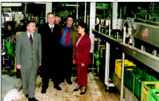
Ministar za europske integracije Neven Mimica posjetio Tvornicu Studenac u Lipiku