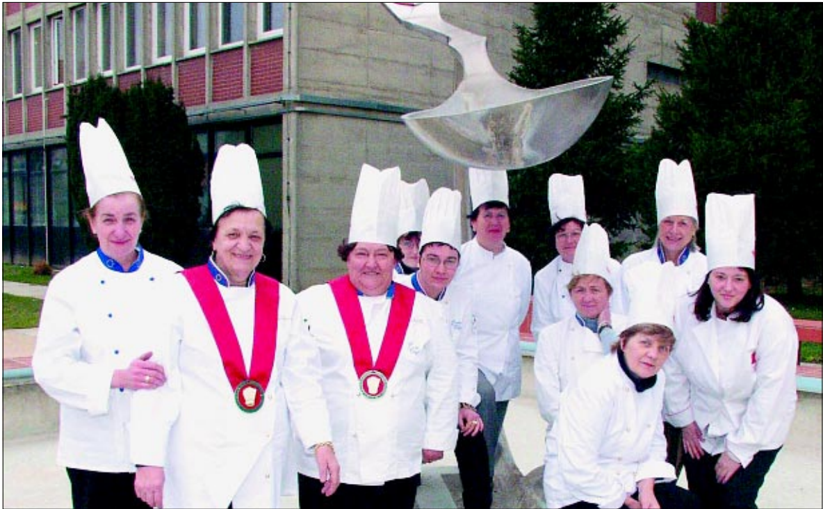
Da li iz ove žlice teče juha? Pitale su članice ženske sekcije talijanske Gastronomske federacije

A da bi talijanski kuhari koji su boravili u Podravki mogli doista postati naši ambasadori, potvrđuje i prva dogovorena akcija. Naime, Gastronomska federacija ima svoj izložbeni prostor na sajmu prehrane koji u ponedjeljak započinje u Udinama i na kojem se očekuje oko 600.000 posjetitelja. Jedan dan na štandu će gostovati članovi Hrvatske sekcije gastronomu i strukovna škola iz Rovinja, a u suradnji s njima predstaviti će se i Podravka. Već su pripremljeni leci na talijanskom, uzorci Vegete, a posjetitelji će moći i degustirati jela sa svjetski poznatim dodatkom jelima koji eto kreće i u osvajanje Italije.