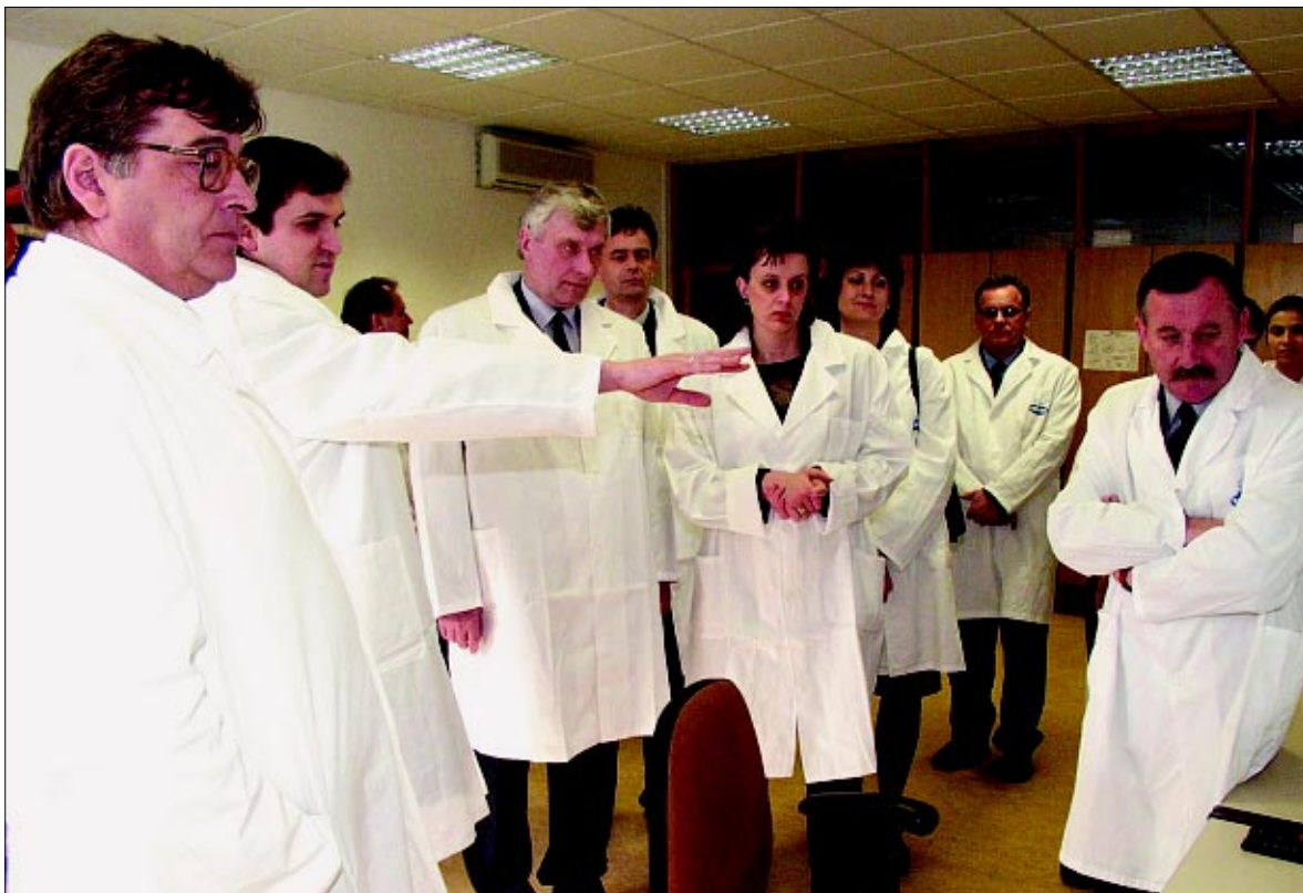
Bugarska delegacija pokazala veliko zanimanje za Podravkinu modernu proizvodnju

Uzvratni posjet slijedi u travnju, kada bi Podravkini menadžeri pokušali uspostaviti direktne i konkretnije kontakte s bugarskim proizvo-