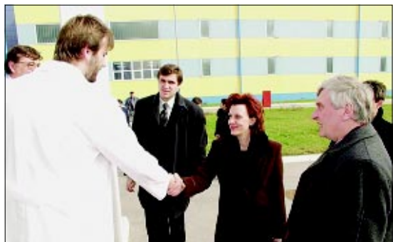
Bugarska delegacija posjetila Podravku

List dioničkog društva "Podravka" Koprivnica