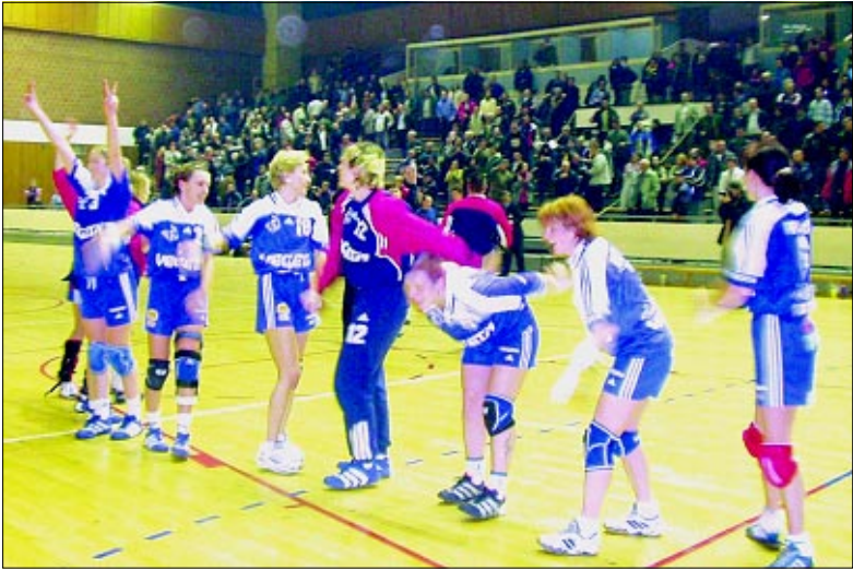
Neriješeno kao pobjeda

Danski Ikast bit će slijedeći protivnik Podravke u Kupu EHF-a. Prvi susret igrat će se 16. ili 17. ožujka u Koprivnici, a drugi tjedan dana kasnije u Danskoj. Očito ždrijež u Beču u utorak nije baš po mjeri Koprivničanki, jer Ikast u kojem uz domaće igra i nekoliko jakih strankinja (najpoznatija je njemačka reprezentativka Jurack) važi za jednog od favorita u ovom natjecanju.