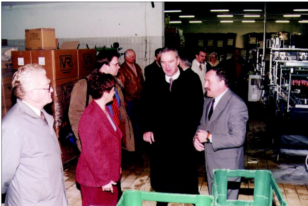
Ministar Mimica sa zanimanjem je razgledao Tvornicu Studenac

- Ova tvornica je primjer dobre poslovne odluke ulaganja u proizvodnju vode. To je bila sigurno dugoročno važna odluka Podravke, pogotovo kada se zna u kakvim uvjetima je ta tvornica obnavljana. Prema tome, mislim da Podravka s tom tvornicom ima dugoročnu budućnost, jer idući ratovi će se voditi za vodu, a ne za naftu. Pravi posao se vodi ovdje u