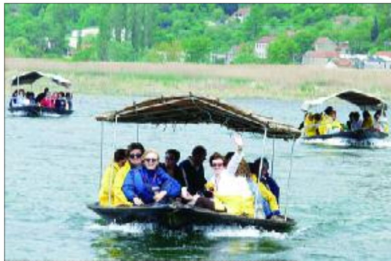
Dobrom raspoloženju pridonijela je i vožnja lađama po rukavcima Neretve