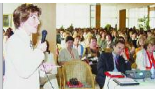
U Tučepima održani tradicionalni Dani Belupa - Belupova škola zdravlja 4. str.