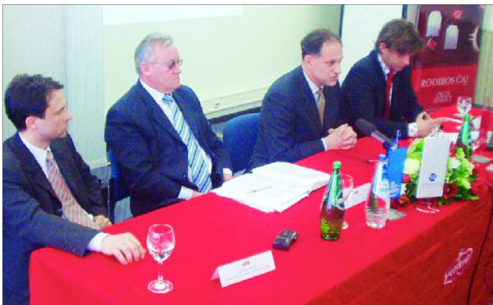
Prezentacija rezultata poslovanja Podravke u prvom ovogodišnjem kvartalu