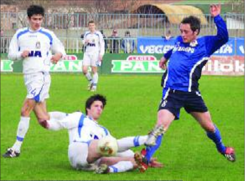
Slavenova mladost nije uspjela u Vinkovcima