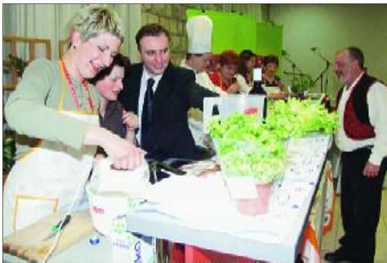
Kulinarski dvoboj budno je pratio ocjenjivački sud isprobavajući Podravka juhu, Talianettu i Dolcela parfe kremu